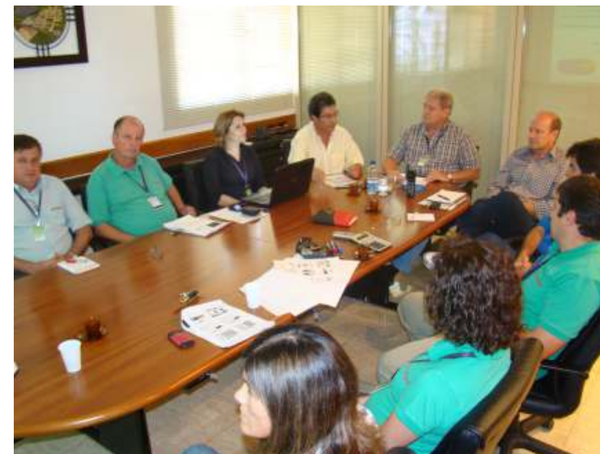
Ações do Programa Produz Leite foram amplamente debatidas em reuniões internas