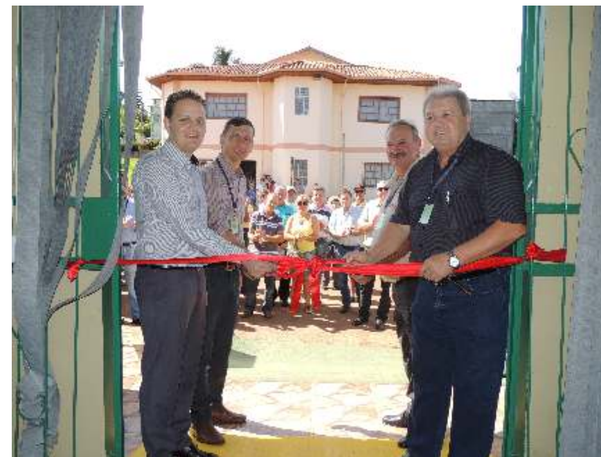
Inauguração do Supermercado em Coqueiros do Sul.

O planejamento estratégico é definido anualmente com base em sugestões dos associados e demandas apresentadas, que são analisadas quanto à viabilidade técnica e econômica para serem implementadas.