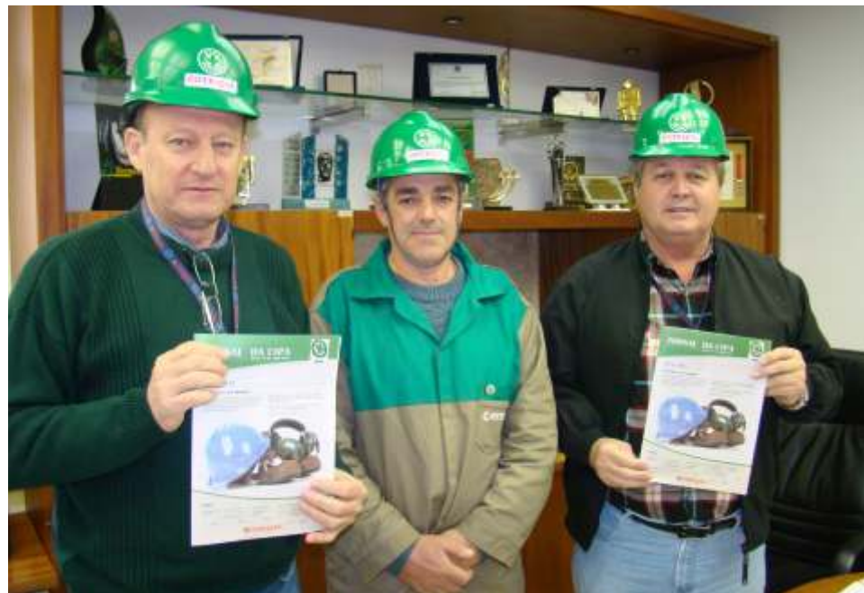
CIPA inovou, distribuindo jornal aos colaboradores