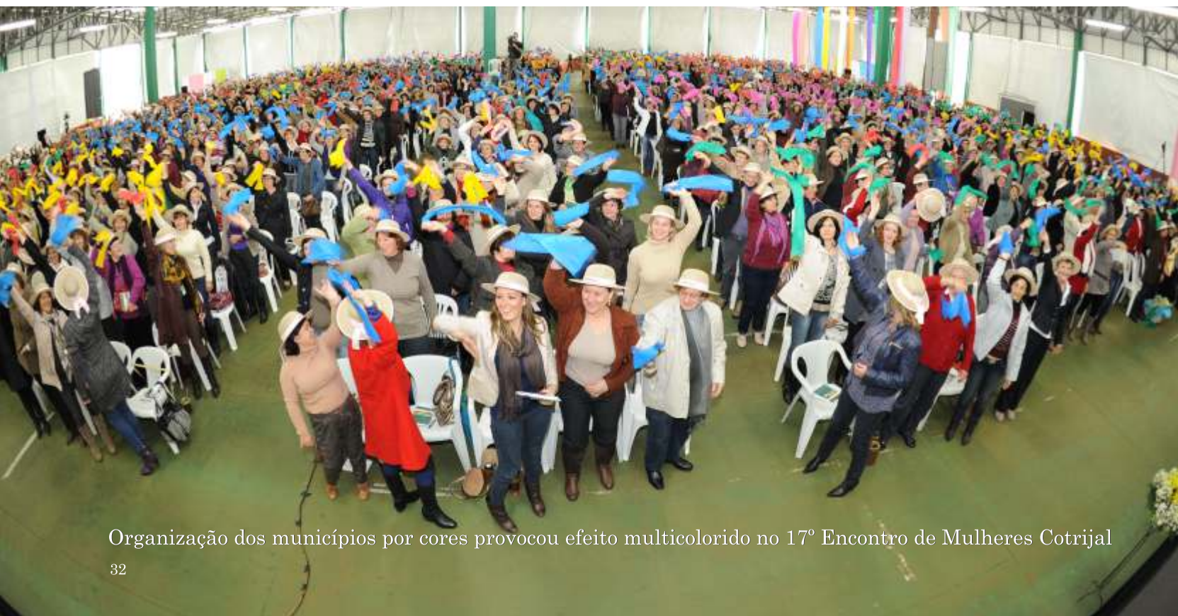
Organização dos municípios por cores provocou efeito multicolorido no 17º Encontro de Mulheres Cotrijal

O Encontro de Mulheres Cotrijal é um acontecimento importante e que reflete o caráter amplamente participativo da cooperativa. Nele, as mulheres das famílias dos cooperados são estimuladas a refletirem sobre sua condição junto à família e à frente dos negócios, através da troca de experiências nos mais diversos assuntos, que vão desde motivação e autoestima até a definição de estratégias para uma maior inserção na dinâmica social e organizacional.