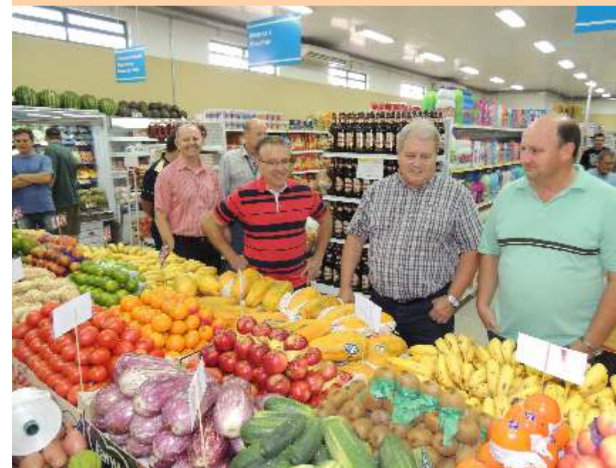
Reinauguração do Supermercado em Victor Graeff.

Também a rede de supermercados foi reaquecida com a instalação de um novo supermercado em Coqueiros do Sul, e ampliação e melhorias no supermercado de Victor Graeff, que foi atingido por um forte temporal em setembro de 2012, e reabriu suas portas 78 dias depois, num espaço maior e mais modernizado. Com mais de 5 mil itens em produtos alimentícios, higiene, limpeza, frutas, verduras e legumes, estes dois estabelecimentos contribuíram para um melhor faturamento na área de varejo, e dos números da cooperativa.