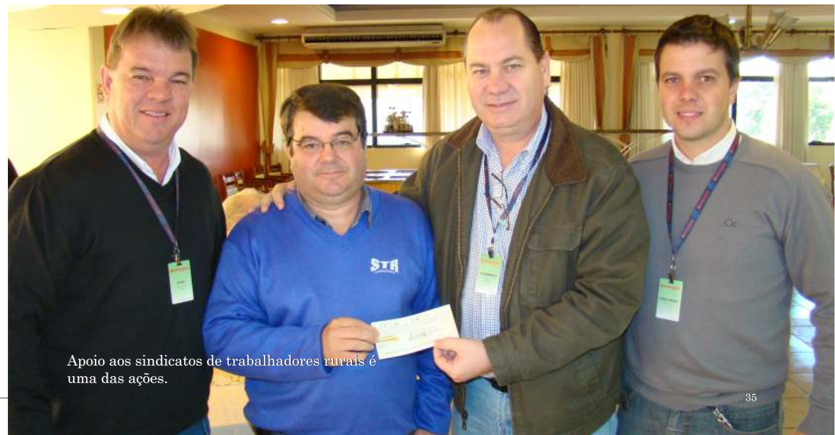
Apoio aos sindicatos de trabalhadores rurais é uma das ações.

Sempre muito próxima das comunidades, a Cotrijal se faz presente em movimentos sócio-culturais e de defesa da classe trabalhadora rural: contribui financeiramente com sindicatos de trabalhadores rurais, visando fortalecê-los em sua representatividade, e ainda reúne-se várias vezes por ano com seus dirigentes para debater assuntos de interesse dos produtores. A cooperativa também contribui sistematicamente com entidades beneficentes como asilos, creches, APAES e campanhas de escolas.