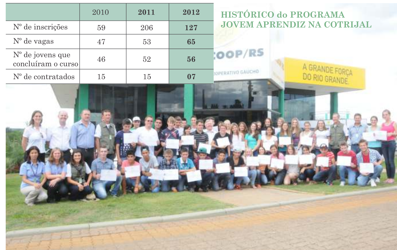
HISTÓRICO do PROGRAMA JOVEM APRENDIZ NA COTRIJAL